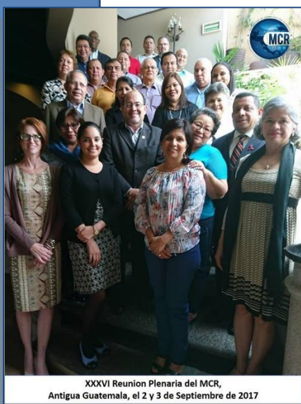
XXXVI Reunion Plenaria del MCR, Antigua Guatemala, el 2 y 3 de Septiembre de 2017

Celebrada el 2 y 3 de septiembre del 2017 en la ciudad de Antigua, Guatemala con el objetivo principal de revisar y avalar la Nota conceptual Regional de Malaria, representantes de los Ministerios de Salud de todos los países de la región junto con representantes de la sociedad civil, cooperación y SE-COMISCA, acudieron a esta reunión donde se establecieron puntos clave para la coordinación de la propuesta y también se revisaron otros puntos aprobando también la plataforma del sistema de vigilancia epidemiológica regional de VIH que está siendo construida por la SE-